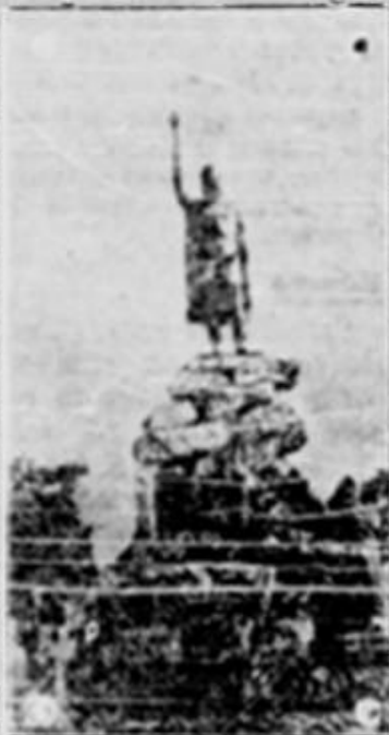
Mircea cel Bătrân — Tulcea