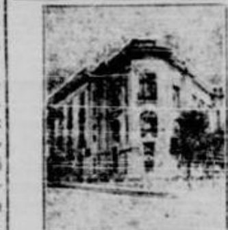
Camera de Comerț