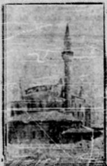
Moschee — Bazargic