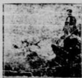
Scafandrii la lucru

Agriculturii a întocmit un decret-lege care p n: obliga-